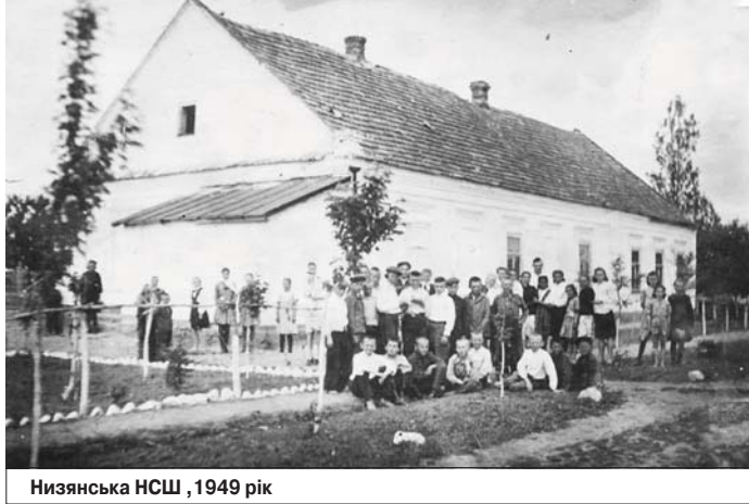
Низянська НСШ, 1949 рік

У роки Другої світової війни (січень-квітень 1944 р.) тут розміщувався штаб та ідальня 16-го авіаполку, яким командував