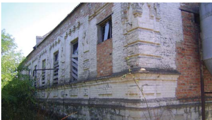
Низянська церковнопарафіяльна школа